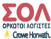
ΒΑΣΙΛΕΙΟΣ Ε. ΠΑΤΕΡΟΜΙΧΕΛΑΚΗΣ Αρ Μ ΣΟΕΛ 14421

Συνεργαζόμενοι Ορκωτοί Λογιστές α.ε.ο.ε. μέλος της Crowe Horwath International Φωκ. Νέγρη 3, 11257 Αθήνα Αρ Μ ΣΟΕΛ 125